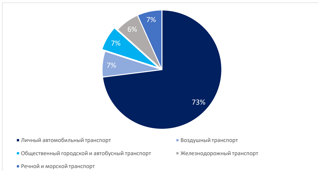
Рисунок 1. Соотношение объемов расходов домохозяйств Франции на различные виды транспорта, 2019 г.

При этом на автомобильные перевозки на личном транспорте пришлось 73% транспортных расходов, 7% – на воздушный транспорт, 6,7% – на общественный городской и автобусный транспорт, 6,6% – на железнодорожный транспорт, 6,7% – на речной и морской транспорт. Домохозяйства были источником половины произведенных транспортных расходов.